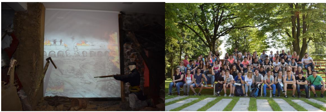
Hangulat a várban

Az uzsonna kiosztása után, már indultunk is Szigetvárra. A várnak és történetének a megismerésében egy nagyon kedves hölgy segített. A viaszbábúk, filmek és hangok segítségével, teljesen beleélhettük magunkat a csata közepébe.