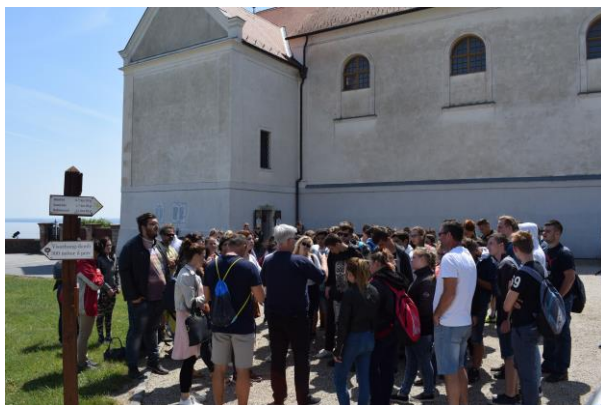
Megbeszélés az apátságban

Egy éjszakai vihar után, vasárnap mindenki korán kelt, mert időben akartuk átadni a szobákat, valamint hosszú út várt ránk. Reggeli után elutaztunk Tihanyba, ahol a levendulákon és a barlangokon kívül, megnéztük a várost és az apátságot is /bár ezt csak kívülről/. Az erős szél miatt hullámzó Balaton nagyon szép látványt nyújtott.