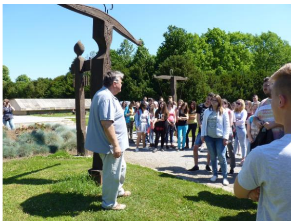
Előadás az emlékparkban

2017. május 21-én, pontosan 7 órakor indultunk el a kollégium elől. Az előzőleg beszerzett ételeket és italokat már időben beraktuk a buszok aljába. Bár az eredeti elképzelés szerint csak Mohácson álltunk volna meg, de közbeiktattunk egy rövid megállót Baján is. Ennek ellenére 10 óra körül megérkeztünk az emlékparkba. Bár személy szerint már többször is jártam itt, de a mostani előadás volt a legjobb mind közül. A fegyverbemutaton mindenki kipróbálhatta a kardokat, sisakokat, láncingeket.